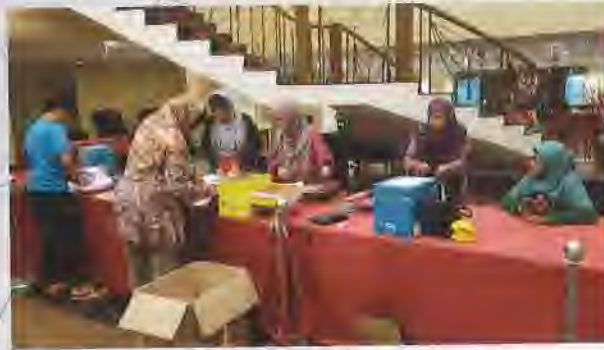
PERSIAPAN MESYUARAT AGUNG