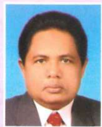
SDRA MUHAMAD BIN SAAD, PJM ANGGOTA LEMBAGA