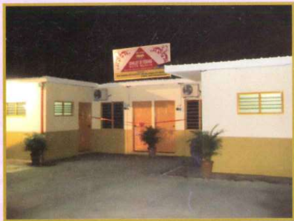
CHALET & SHELAY BARU

Suasana malam yang dingin air sungai yang laju mengalir sudah boleh menarik orang ramai dan memang sesuai bagi pencipta alam dengan adanya TV besar sambil makan dan menonton.