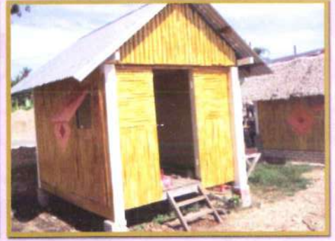
Chalet dan Shelay didalam pembinaan

Sebuah dewan terbuka juga akan dibina disebelahan restoran untuk sebarang aktiviti Seminar Persendirian, Keluarga, Ngo atau lain-lain lagi. Dari segi susun atur kawasan ini saya percaya ianya akan dapat menarik para pelancong tempatan atau orang ramai untuk terus menginap di Chalet atau Shelay disitu.