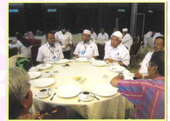
Suasana Mesyuarat Agung Kali Ke 28 Pada 27 Jun 2010